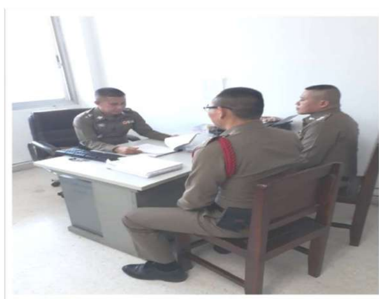
รอง ผกก.(สอบสวน) หน.งานสอบสวน ตรวจสำนวนของ พงส.