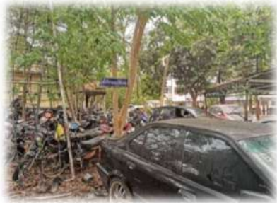
ที่เก็บรถอุบัติเหตุ