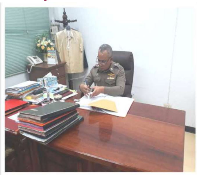
ผกก.ตรวจสำนวนของ พงส.