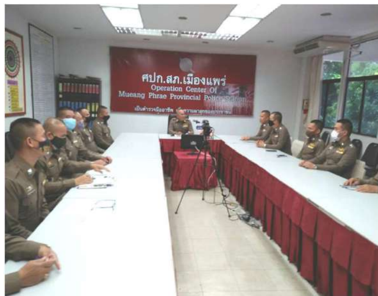
ผกก.ประชุมชี้แจงการปฏิบัติงานของ พงส.