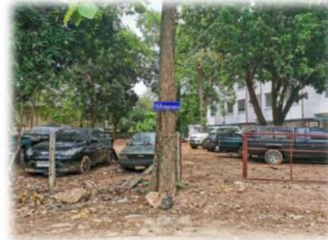
ที่เก็บรักษาของกลาง