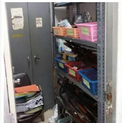
สถานที่เก็บและสมุดคุมรถยึดตรวจสอบ