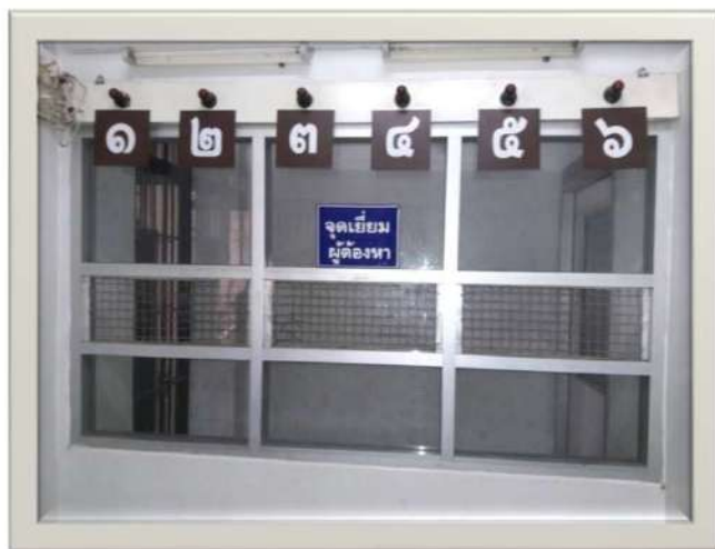
ห้องชี้ตัวผู้ต้องหา