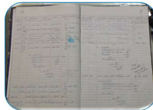
สมุดควบคุมการจ่ายเงินค่าตอบแทนพยาน